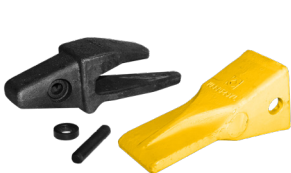
Tannsett type Cat

Tannsett fås som tilbehør og leveres da ferdigmontert.