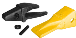
Zahnsatz Typ Cat

Der Zahnsatz ist als Zubehör erhältlich und wird komplett montiert geliefert.