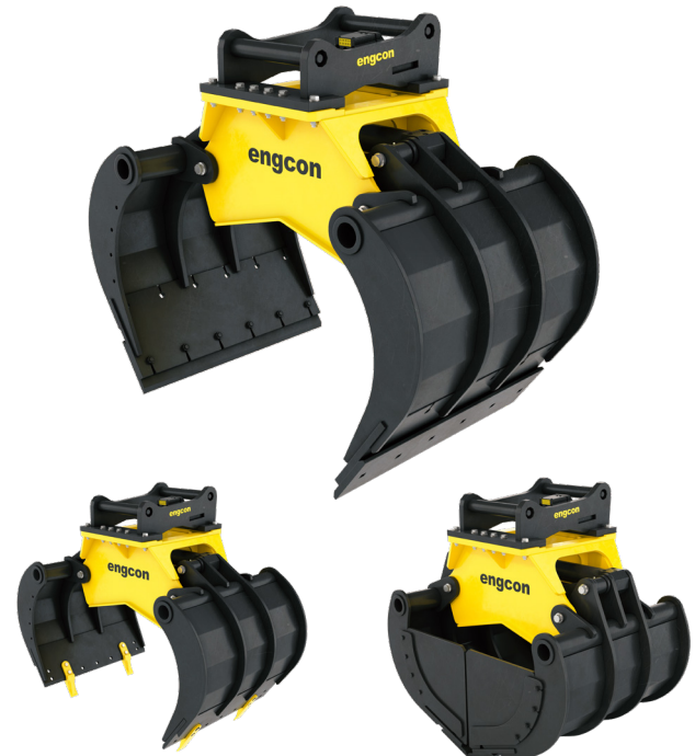
Med tænder (tilbehør)

* Gælder gribeklo med hurtigskift S40–S80.