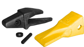
Jeu de dents type de CAT

Le godet peut également être livré avec un jeu de dents, disponible en option.