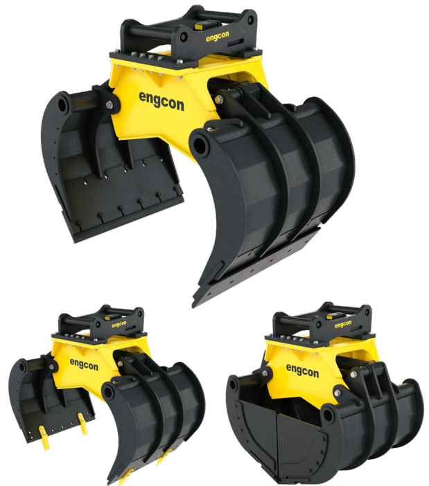
Avec dents (accessoire)

Le bloc EC-Oil est inclus sans frais supplémentaires avec tous les outils hydrauliques engcon avec une attache rapide S40 à S80.